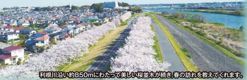
利根川沿い約850mにわたって美しい桜並木が続き、春の訪れを教えてください。